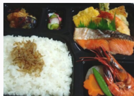
■和デラックス弁当